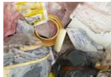
スプレー缶とライター