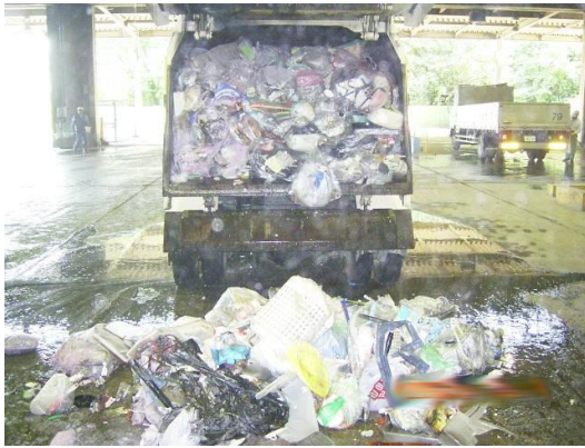
焼損した荷箱内部のごみ

原因は、焼損したごみの中から使い捨てライターが発見されたことから、収集作業中荷箱内の回転板でゴミを圧縮した際、点火スイッチが押されこのライターに火がつき、周囲のごみに着火したものです。