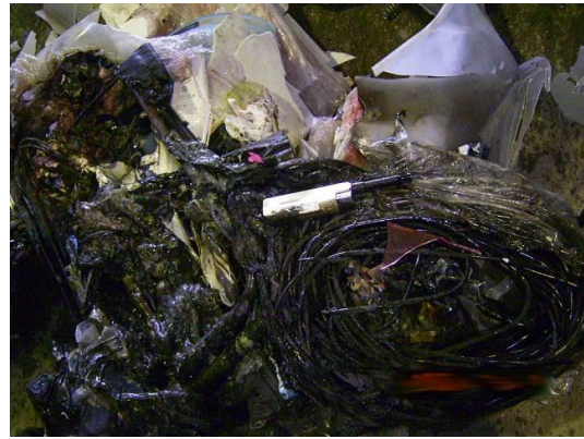
焼損したごみとライター