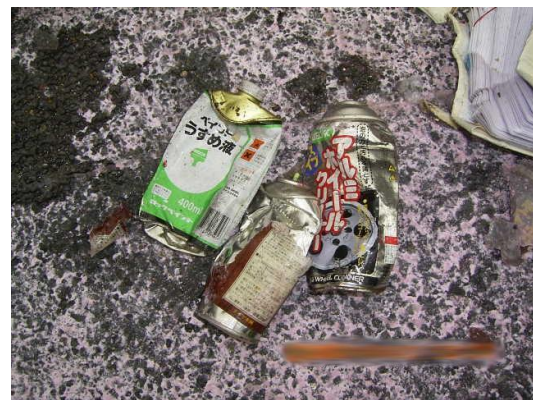
破裂したスプレー缶