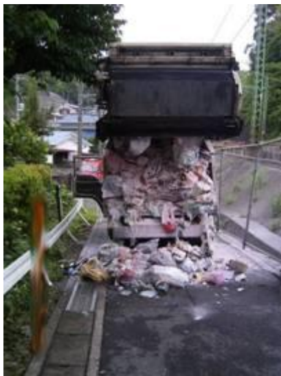
焼損した荷箱内のごみ

原因は、不燃ごみとして収集されたごみの中から、スプレー缶とライターが発見されたことから、回転板でごみを圧縮した際、スプレー缶が押されて内部の可燃性ガスが漏洩し、また、ライターの点火スイッチが押され、この可燃性ガスに引火、周囲のごみに着火したものです。