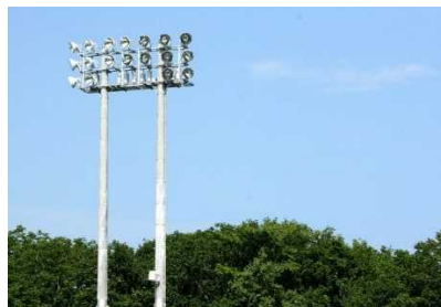
スポーツ施設の照明