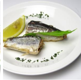
燻製イワシのオイル漬け