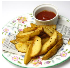
スパイシーポテト