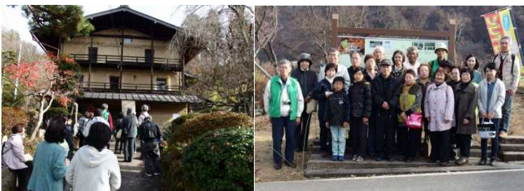
赤岩地区重要伝統建造物群保存地区の視察