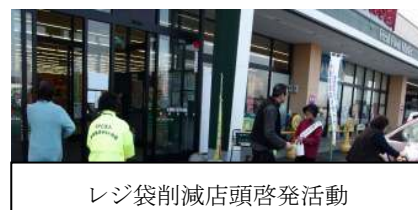
レジ袋削減店頭啓発活動