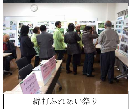
綿打ふれあい祭り