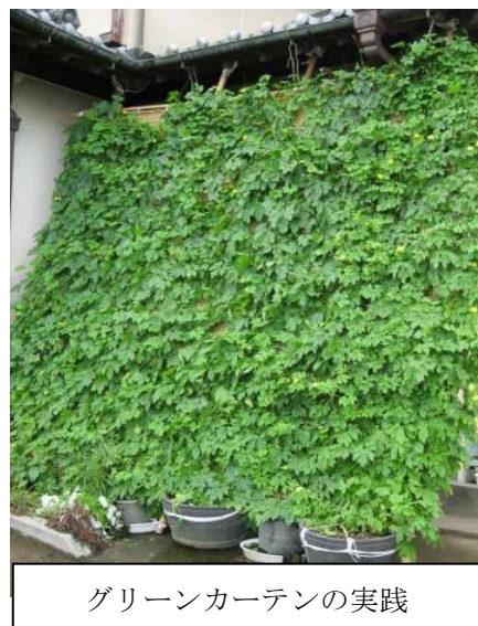
グリーンカーテンの実践