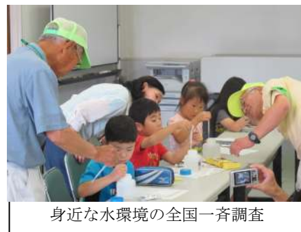
身近な水環境の全国一斉調査