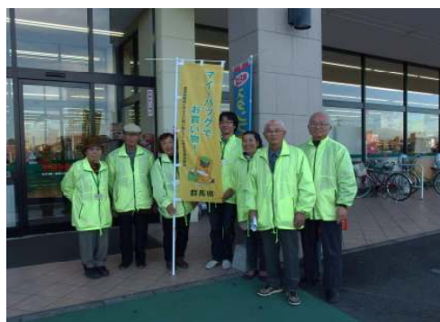
調査参加のみなさん