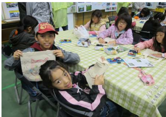
「マイバック上手でしょう」！！