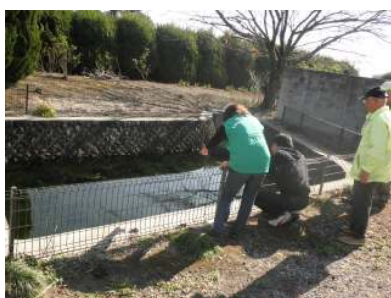
整備された清水湧水地