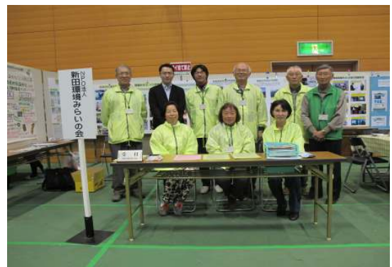
みなさんおつかれさまでした。