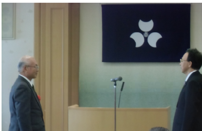
青木環境森林部長から頂く

湧水地のクリーン作戦や生物多様性の調査の実施など、新田地域湧水群を中心にした自然環境保全活動に尽力している。また、地元生品小学校の土曜スクールでの自然観察会、レジ袋削減のPR活動等、環境美化や地域住民の環境に対する意識の向上にも貢献している。