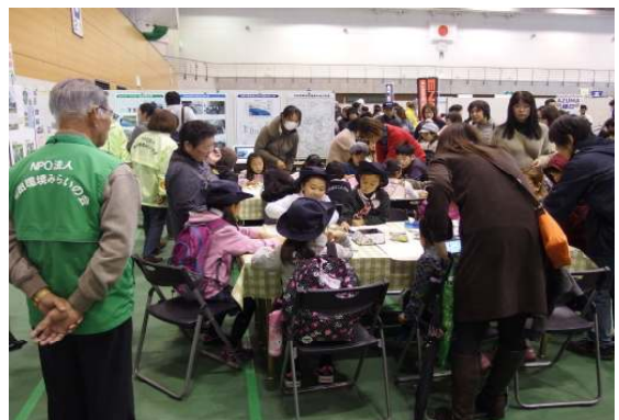
世界に一つのマイバックコーナ