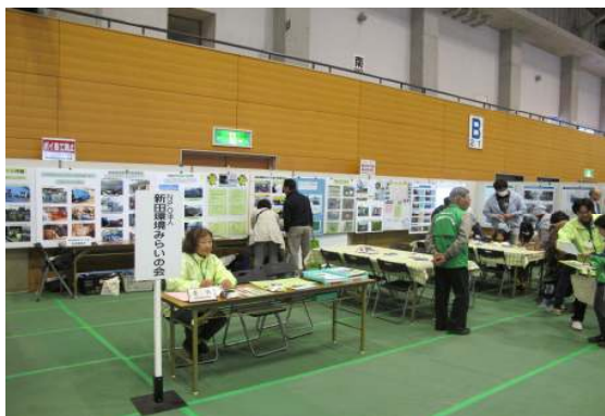
会場の準備完了「お客さん待ち」