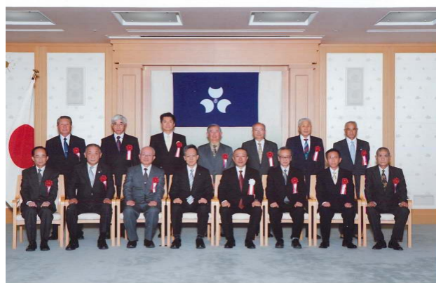
平成26年度 群馬県環境賞顕彰式 平成26年11月13日 群馬県庁正庁の間