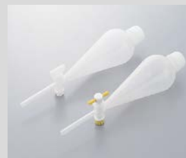
●PP分液ロート （スキープ型）