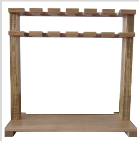
●6連式CEC測定用スタンド CEC-6型

ショーレンベルガー法による土壌のCEC（Cation Exchange Capacity “陽イオン交換（塩基置換）容量”）測定用スタンドです。木製で6連式となっています。