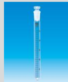
●共通共栓目盛付試験管