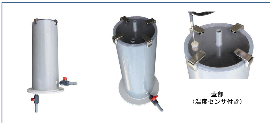
蓋部 (温度センサ付き)

本装置は安価な塩ビ材料を使用した、牛の糞尿処理に関するガスの脱硫試験等に用いる試験槽です。蓋部はファスナーで簡単に脱着ができるようになっています。