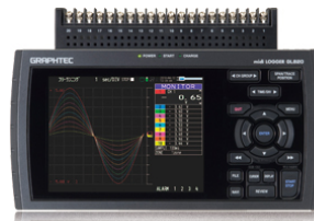
GL820型 入力20CH (～最大200CH)