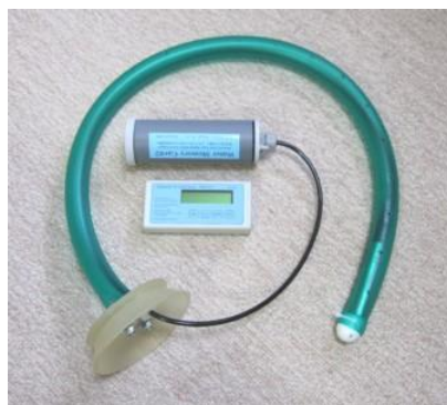
●ルーメン内レベル測定装置セット