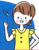
デイサービス職員

レクリエーションの時間を担当するのが楽しみになりました。今までは、なにかしなければならなくて憂鬱でしたが、今は、利用者のみなさんの「楽しい」時間を創ることができて、自分自身も充実しています。