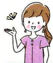
社会福祉協議会職員

対象者に寄り添ったコミュニケーションの取り方ができるようになったことで、指導の場面だけでなく、仲間との関係も良くなりました。