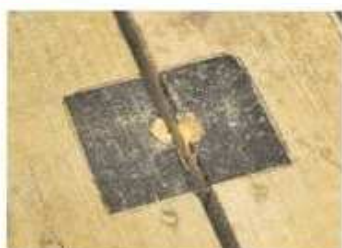
ダボは床(地面)にあけた穴に差し込む