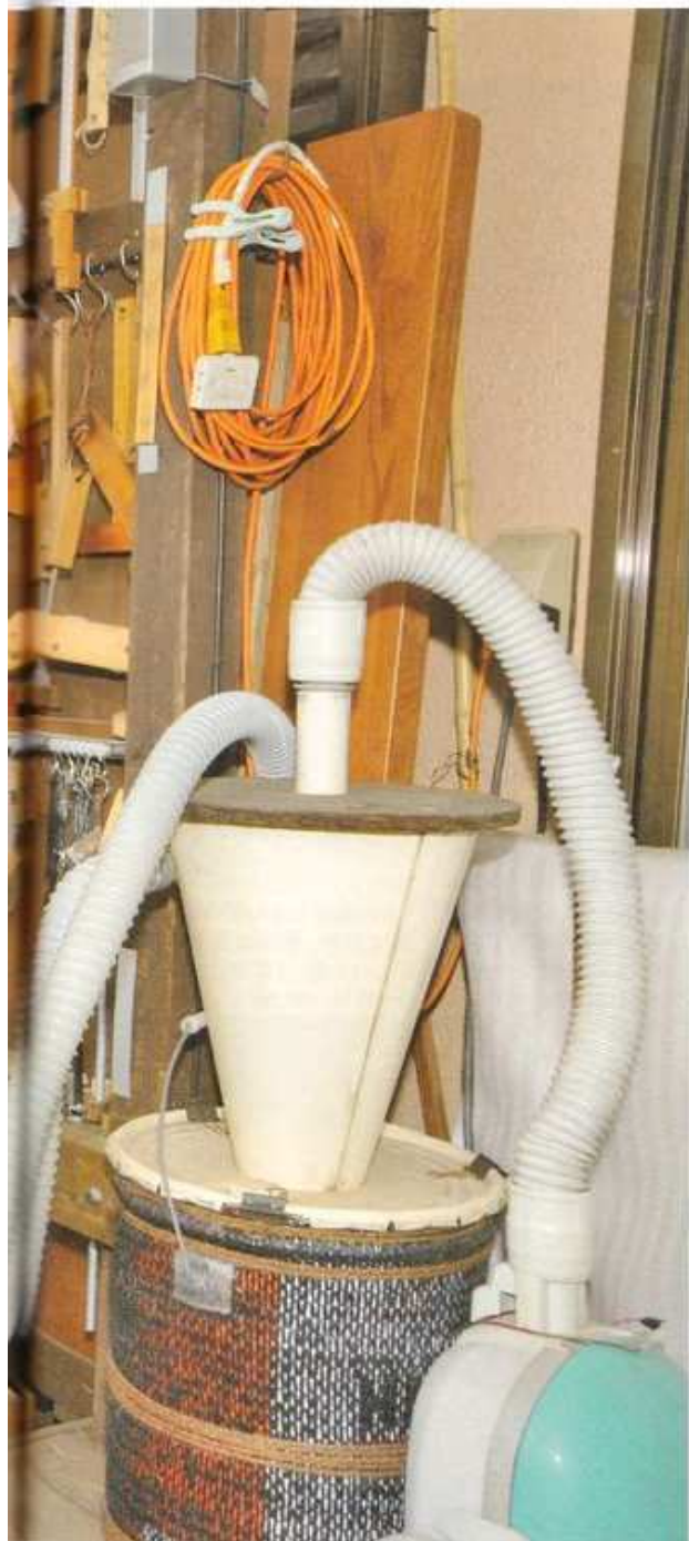
青空工房の木工でも細かい木くずが出る作業では、サイクロン集じん機があった方が効率よく掃除ができるそう