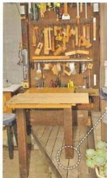
元の天板は壁面収納を覆い隠す大きさだったが、偶然手に入れた24mm厚の集成材に替えた。両面塗装され、滑りやす過ぎたので合板を載せて作業を行なう

これらの作業台&道具収納のセットを製作した結果、青空工房がより快適になった。唯一、蚊の季節と風が強い日は、やっぱり外はツライと感じるそう。しかし、真夏と真冬の作業は結構余裕で、むしろ「近所が窓を閉め切っている季節なので、気兼ねなく電動工具を使えるチャンスです！」と力説。DIYの楽しさが厳しい季節を乗り越らせてくれるのかもしれない。