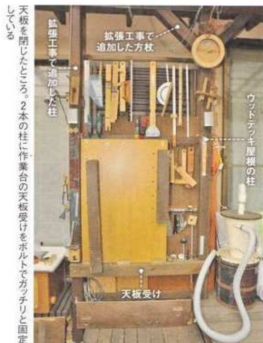
天板を閉じたところ。2本の柱に作業台の天板受けをボルトでガッチリと固定している