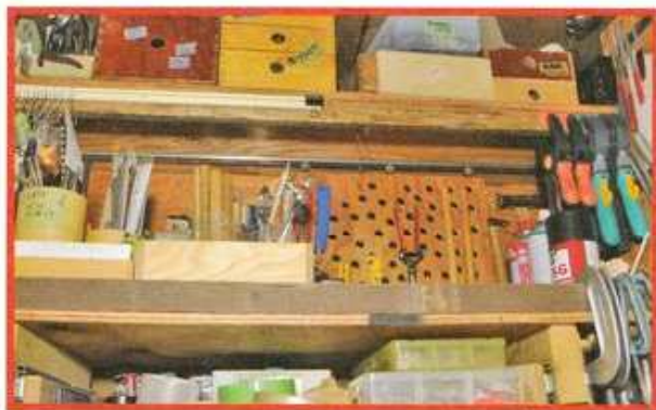
カッターなどが掛けられたハンギングボードは、カーテンレールに掛けられている