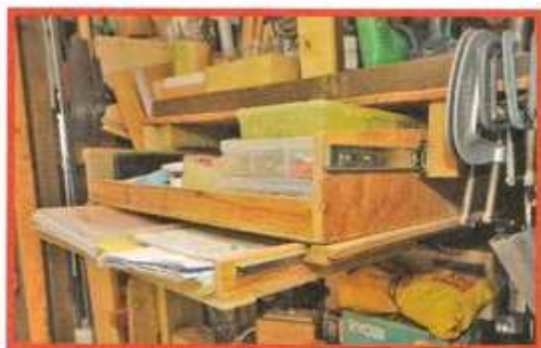
上段の引き出しにスライドレールを使用。下段はアングルを使っている