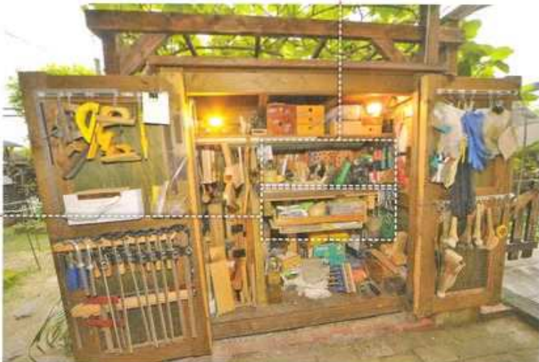
扉にティッシュペーパーホルダーがつけられている。サインガネはマグネットに貼り付けられている