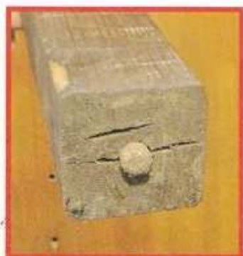
脚にはダボが取り付けられている