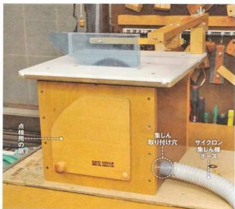
テーブルソーの箱を作業台にセットしたところ。天板を変えればトリマーテーブルになる