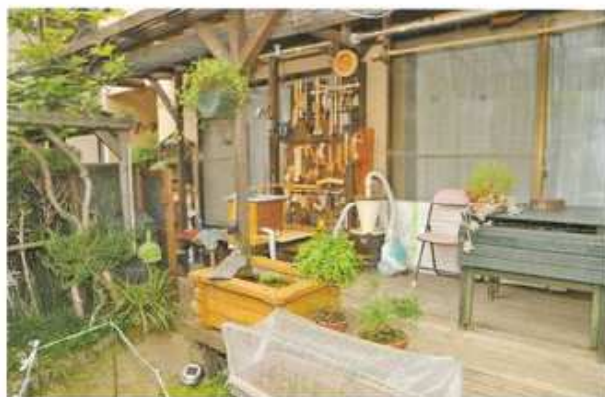
屋根はウッドデッキ部分までしかなかったが、作業台を作るときに拡張した。デッキ上(左端)にはメダカの池が作られている