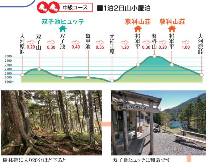
樹林帯に入り20分ほど下ると