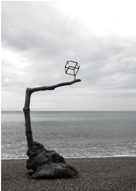
「漂流物」流木など 2018 年

作品は主に「自然の形」からヒントを得ています。自然界には、時の移ろいがつくりだす様々な形があります。そんな圧倒的に豊かな自然の形を眺めていると、いまさら自分が何か別の形を作り出す必要があるのか、と思わせられることもあります。