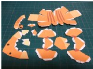
きれいに切り取る