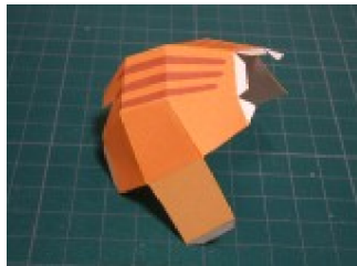
胴体を作る (まだ腹は閉じない)