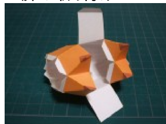
胴体に脚を取り付ける (まだ腹は閉じない)