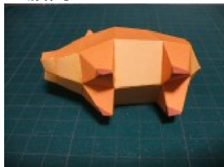
腹を閉じる (先にのりしろがある方を貼 り、もう一方はフタを置くように 貼る)