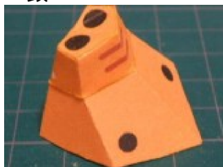
頭を作り 鼻を取り付ける