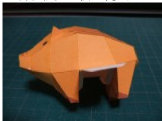
胴体に頭と尻を取り付ける (頭から指を入れて、丁寧に付ける)