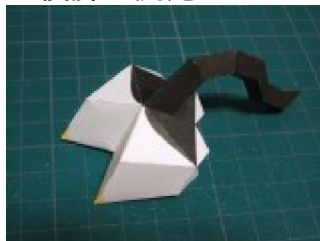
後脚 + 尻尾