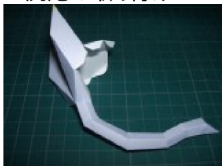
後脚に尻尾を取り付ける