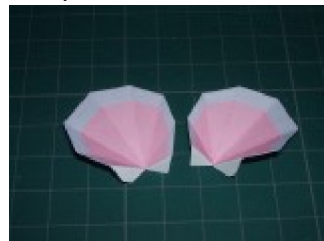
耳の表裏を貼り合わせる