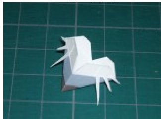
鼻にヒゲを取り付ける ヒゲはまだ起こさないほうがいい