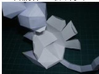
右胴体を取り付ける 首とお尻の所はまだ貼らない方がいい