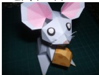
ヒゲを起こし、 チーズを好みの位置に 糊付けする