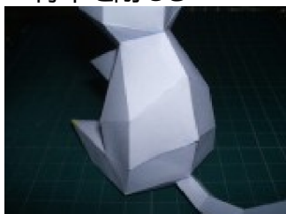
背中を閉じる 首とお尻のトコから閉じ、 最後に真ん中を丁寧に閉じる