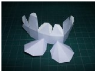
頭に耳を取り付ける 後頭部はまだ閉じない