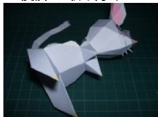
後脚を取り付ける