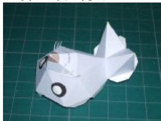
顔に鼻を取り付けて作る