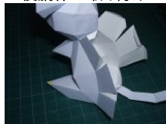
左胴体を取り付ける