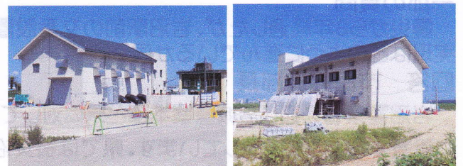
完成まじかな相野釜ポンプ場、藤曾根ポンプ場

建屋本体が平成25年度に完成し現在、ポンプ、機械、設備などの据えつけ工事を行っています。本年8月末には新しいポンプの試運転を行い9月から本格的稼働する予定と伺っています。