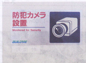
防犯カメラ設置を 今後検討