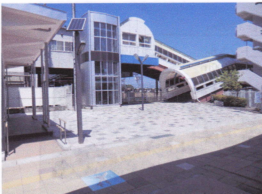
待たれる岩沼駅前交番予定地

犯罪の抑止、あるいは犯罪発生時の捜査などに大変有効なものと認識しております。今後、岩沼警察署や関係団体と検討会を開催し、防犯効果の検討あるはプライバシーの侵害のないデータの管理、犯罪発生時のデータの活用方法、効果的な設置場所といったことについて、具体的に意見交換をしていきたいと考えています。