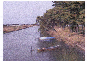
江戸時代に建設した貞山運河（震災前の貞山運河）