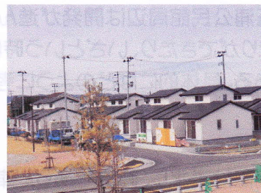
完成の災害公営住宅

そういう史実があれば、子供たちに教えたいと思います。偉大な人物だと思います。やはり記録をきちんと押さえた上で、対応してまいりたいと思います。