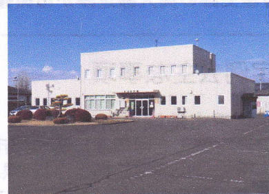
新しい玉浦公民館に

施設整備には当然財源がつくわけで、いろいろ災害復興交付金も含め今調整をしている。財源の確保が最重要として取り組んでいます。