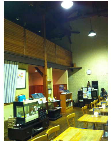
会場の珈琲そうふぁの様子。 天井が高く、ゆったりです。

希少難病、難治性疾患についての情報や、より多くの人に知ってもらいたい理由などに触れていただきながら、集まった方達みんなが仕事、家庭、地域での日々のことをそれぞれに持ち寄り、ともに社会をつくるひとりひとりであることを感じられるような、そんな場にできたらと思っています。