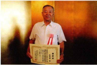
関東甲信越地区危険物安全協会 連合会 会長表彰 林商店 様