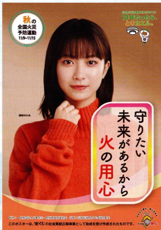
『2024年度 全国統一防火ポスター』