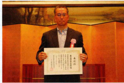
千葉県危険物安全協会連合会 会長表彰 鎌ヶ谷総合病院 様

令和6年6月7日（金）オークラ千葉ホテルにおいて『第34回千葉県危険物安全大会』が開催されました。