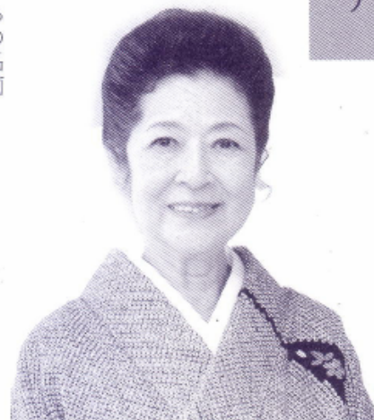
幸田弘子(こうだひろこ)

1932年、東京都生れ。女子美術大学卒。NHK東京放送劇団に入団し、放送、舞台で活躍。1977年から毎年「幸田弘子の会」を開催し、樋口一葉作品の朗読を始め舞台朗読という新しい分野を確立する。他にも『源氏物語』、泉鏡花、森鷗外、夏目漱石、瀬戸内寂聴など、古典から現代文学、詩歌童謡まで幅広く舞台上で朗読。これらの功績により、81、82、84年芸術祭優秀賞、84年度芸術選奨文部大臣賞、95年毎日芸術賞、96年紫綬褒章2002年藤村記念歴程賞、2003年旭日小綬章を受章。