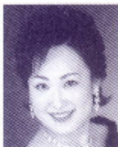
萩原みか[ソプラノ]

1932年、東京都生れ。女子美術大学卒。NHK東京放送劇団に入団し、放送、舞台で活躍。1977年から毎年「幸田弘子の会」を開催し、樋口一葉作品の朗読を始め舞台朗読という新しい分野を確立する。他にも『源氏物語』、泉鏡花、森鷗外、夏目漱石、瀬戸内寂聴など、古典から現代文学、詩歌童謡まで幅広く舞台上で朗読。これらの功績により、81、82、84年芸術祭優秀賞、84年度芸術選奨文部大臣賞、95年毎日芸術賞、96年紫綬褒章2002年藤村記念歴程賞、2003年旭日小綬章を受章。