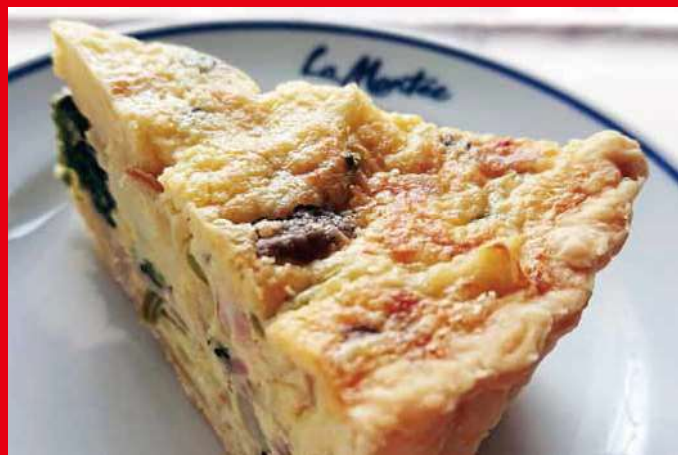
キッシュ ¥500 (税込) (※お電話にてお問合せ下さい)