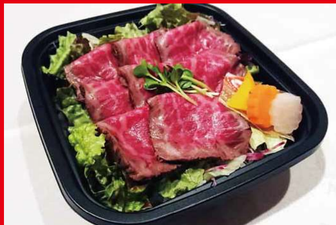
ローストビーフ丼 ¥1,000 (税込) (※事前予約にて注文受付)