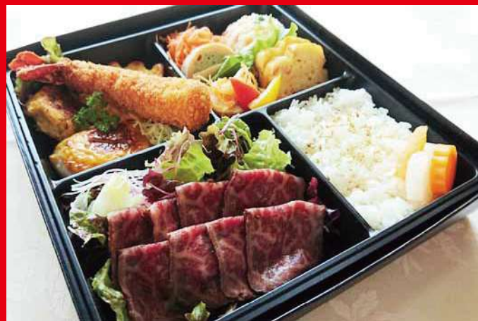
ローストビーフ弁当 ¥3,000 (税込) ※+500円で国産牛フィレ肉に変更可能。 (※前日予約にて注文受付)