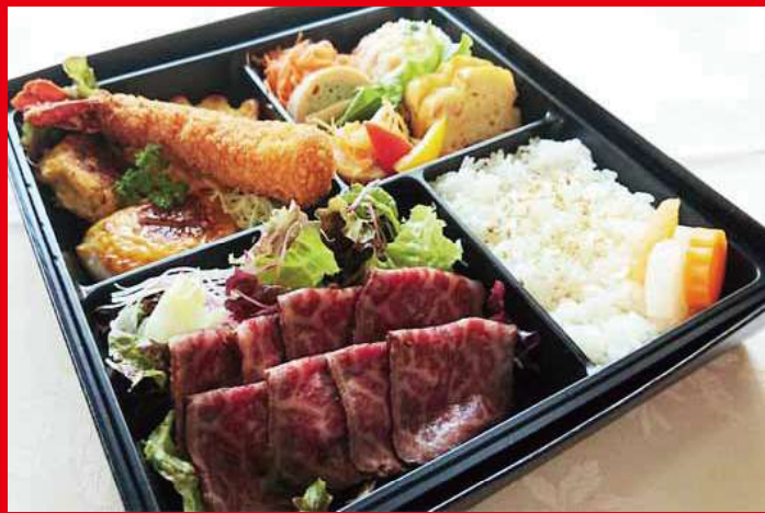
ローストビーフ弁当 ¥3,500 (税込) (※2日前予約・2個以上にて注文受付)