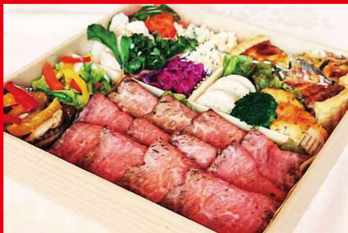
オードブル (3人前) ¥5,500 (税込) (※2日前予約にて注文受付)