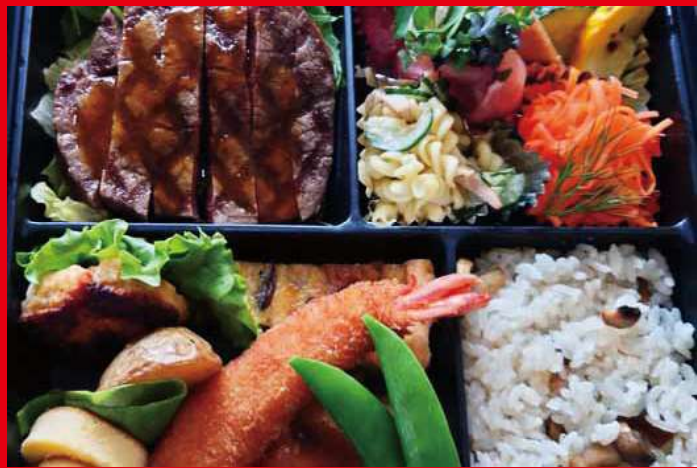
国産牛フィレ肉網焼き弁当 ¥4,000 (税込) (※2日前予約・2個以上にて注文受付)