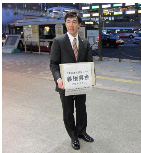
枚方市駅前で義援金の募金活動

被害の大きさから考えて、被災地への支援は長期間にわたるものとは思いますが、私自身が16年前の阪神・淡路大震災で西宮の実家を全壊で失い、地震発生当日から避難所生活を経験していることもあり、復興に向けた取り組みを今後もしっかりと続けてまいりたいと思っております。また、市民の皆様が住み慣れた地域で安心して暮らしていける環境づくりを進めるため、枚方市の防災対策のさらなる充実に向けて、これからも全力で頑張っております。