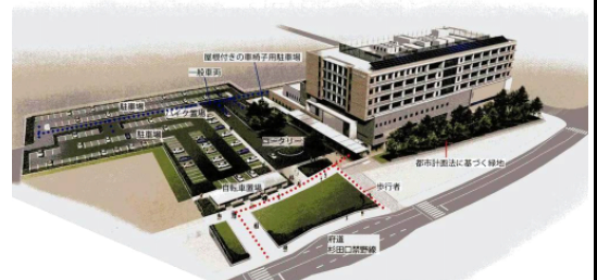
新しい市民病院の完成イメージ図