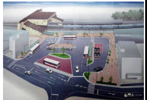
長尾駅前広場整備の完成イメージ図