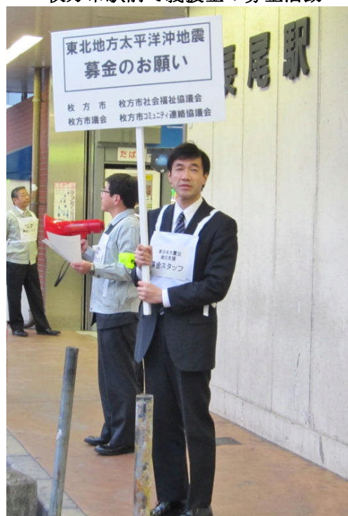
長尾駅前で義援金の募金活動