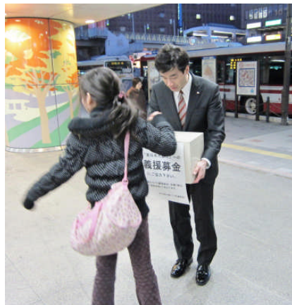
あらゆる年代の方々が義援金の募金にご協力くださいました