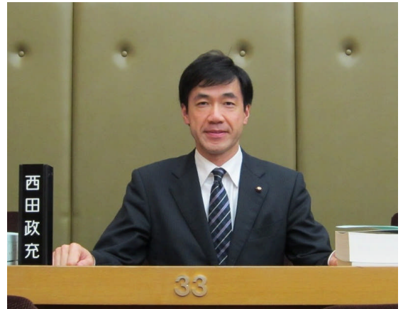
皆様から与えていただいた議席にて

以下に主な議案及びその審議結果をご紹介します。なお、各議案の詳細につきましては、枚方市公式ホームページか、本年5月に全世帯に配布される予定の枚方市議会報をご覧ください。