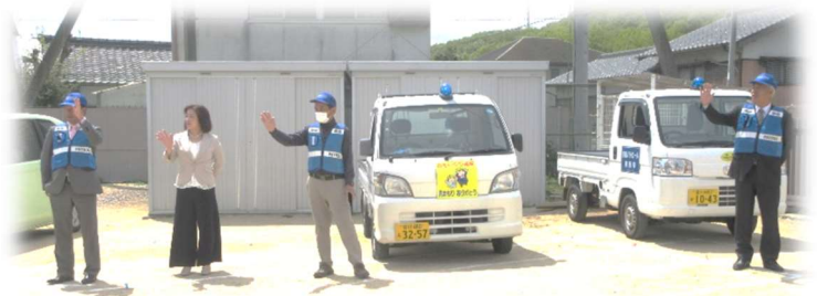
入学式後に青パトを紹介しました。