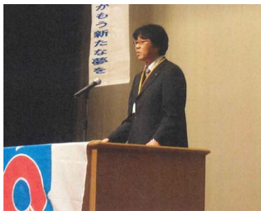
矢口地区長 開会挨拶