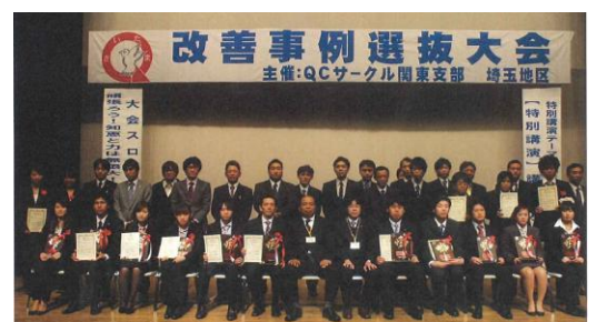
発表された各サークルの皆様