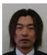
幹事: 西沢宜之 (株アルビオン)