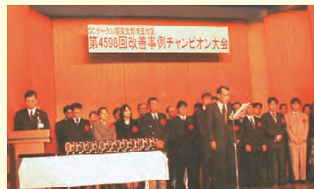
改善事例チャンピオン大会