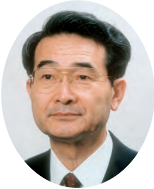
QCサークル関東支部 世話人