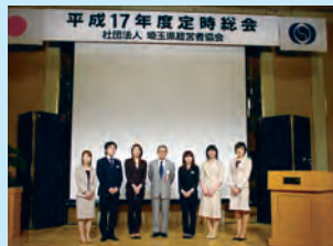
埼玉県経営者協会総会でのモデルサークル発表風景