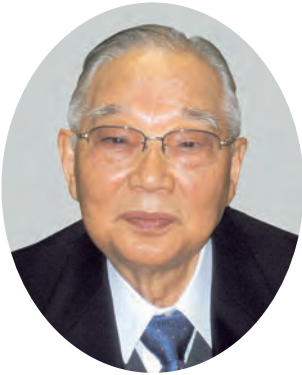
社団法人 埼玉県経営者協会 会長