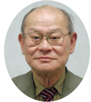
QCサークル関東支部埼玉地区 相談役