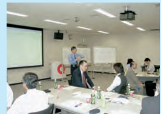
コーチングセミナーによる幹事教育風景