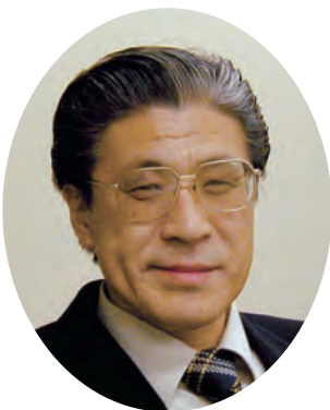
QCサークル関東支部 支部長

埼玉地区が時代の変化に対応した活動で、さらに活性化するためにリーダーシップを発揮されることを期待します。