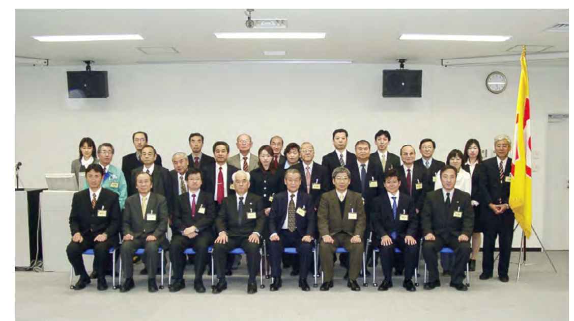
2005年度 第1回幹事会にて