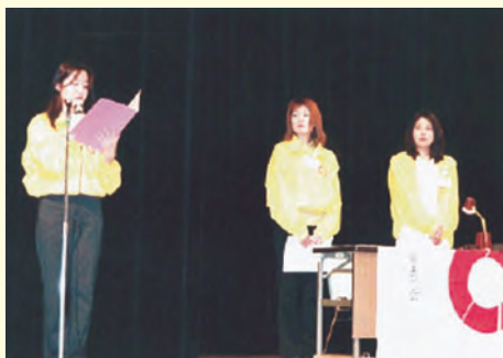
大会で活躍する女性幹事