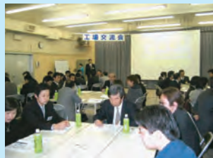
京浜・神奈川地区との事業所見学会