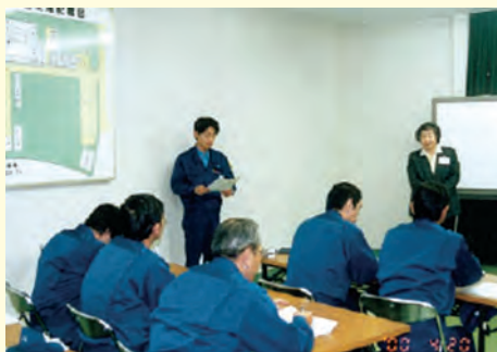
25周年記念無料出前行事