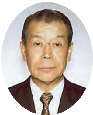
QCサークル関東支部埼玉地区 世話人