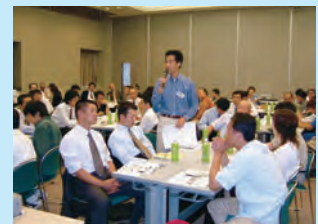
ワイガヤ発表会によるグループ討議風景