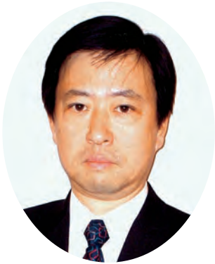
QCサークル関東支部埼玉地区 名誉世話人