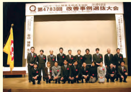
30周年記念改善事例選抜大会