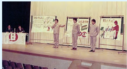
第588回躍進大会 熊谷会館