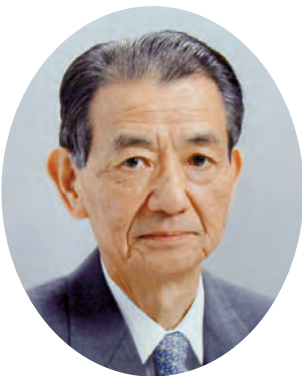
QCサークル本部 本部長

どうぞQCサークル埼玉地区の皆様におかれましては、日本の伝統である「ものづくり」、そして「現場力」の強化をめざした活動を展開され、更なるご発展を続けられますようご期待申し上げます。