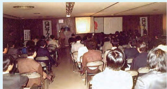
第609回発表呼びかけ大会 越谷福祉会館