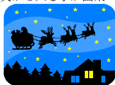
リファイン緑丘 森

昔から サンタさんのソリ に乗って一緒にプレゼントを配ってみたいなあって思っていました。でも高所恐怖症の私には煙突から入る事が出来るかしら???