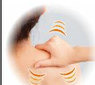
リファイン緑丘 黒田

凝っていない肩と夜中に冷えない足を下さい。あと、カサカサにならないお肌も欲しいです。欲張りですが、是非お願いします。