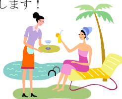
リファイン岡崎北 駒井