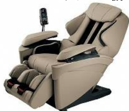
リファイン岡崎北 若杉