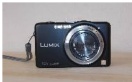
リファイン岡崎北 若杉