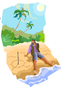
リファイン緑丘 森