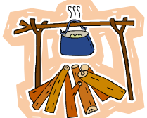
リファイン岡崎北 早川

物ではないですが、 夫か子供 です。一人では寂しいので…力をあわせてサバイバル生活を楽しむ(?)