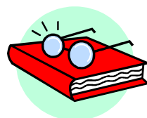
リファイン緑丘 榎原

「 本 」です。時間つぶしにはもってこいかと。ただ、とても目が悪くコンタクト使用なので、「 メガネ 」の方がいいかなあ。