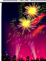
リファイン岡崎北 駒井

無人島なら気兼ねなく打ち上げられるから 花火 がいいかな。火をつけてくれる人が必要ですけどね。。