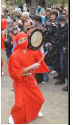
リファイン緑丘 黒田

近所で「 てんてこ祭り 」という奇祭が毎年お正月にあります。ただお正月は外出しないので、ニュースでしか見たことが無いです。