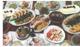
リファイン緑丘 森

子供の頃、お祭りの日は食卓に 御馳走 が並んでしかも 食べ放題 !! 嬉しかったなあ(´_`)