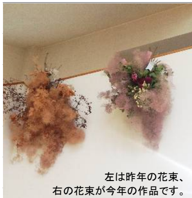
左は昨年の花束、 右の花束が今年作品です。

した。この情報誌にも花を少しずつ同封させていただきました。香りを楽しんでいただけたら嬉しいです。