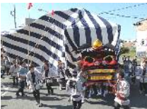
リファイン岡崎北 若杉

子供の頃 はっぴを着て町内を練り歩きました。 掛川大獅子と屋台 です。お囃子の音が町中に鳴り響きわくわくしたのを覚えています。