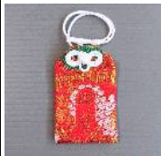
リファイン緑丘 原田

毎年祖母が 地元の神社でお守り を買ってきてくれるので、そのお守りをいつも持っています。おかげで病気や怪我もなく元気に過ごせていると思います。