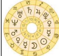
工務 山本 大助