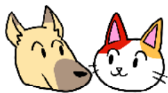
丸吉 と 豊子