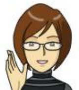
担当コーディネーター・森

お住まいを「大事に住み続けたい」というH様のご要望を間取り替えと耐震補強で実現させることができました。できあがりのイメージをわかりやすく伝えられるように、パースや施工例の写真などを見ていただいて、梁や天井の仕上げ、光の採り入れかた、階段の形状などをご提案しました。奥様のご希望だった「コーヒーとクラシック音楽が似合う、寛ぎ空間」に仕上がりに、とてもうれしく思います。