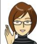
リファイン緑丘 森