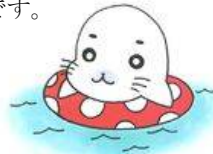
リファイン岡崎北 駒井

「ゴマちゃん」と呼ばれたことがあります。アザラシのゴマちゃんが話題になったときです。