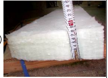
断熱材の断面です。