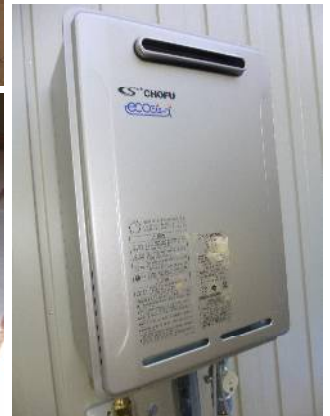
↑ 高効率ガス給湯器エコジョーズ