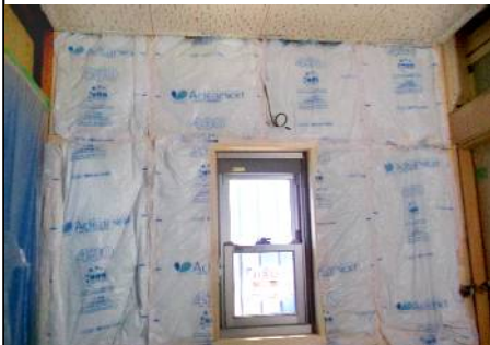
床・壁・天井に断熱材を取り付けます。↑ ↓ ↗ ↘

岡崎市のA様のリフォームを担当させていただきました。間取り替えや外装・内装のリニューアルをご希望でしたので、省エネ補助金の活用をお勧めしました。耐震・断熱・ガラス取替・高効率給湯器などが補助金の対象です。