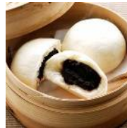
リファイン緑丘 森

普通に名前と呼ばれてましたが、一部の男子に「あんまん」と呼ばれてました。その頃は顔がまんまるでしたから(。)