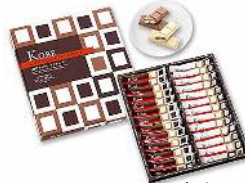
リファイン緑丘 若杉

沖縄土産の 紅芋レアケーキシュリ がとても美味しかったので、自分で沖縄に行った時に買ってお土産にしました。