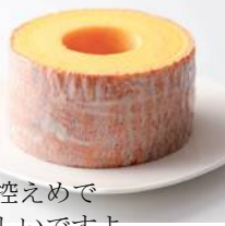
リファイン岡崎北 駒井