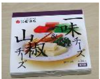
リファイン矢作 塚本

京都三年坂にある唐辛子屋さんの 唐辛子入りチーズ と物産展でよく買う北海道六花亭の マルセイバターサンド です。