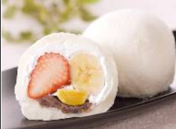
リファイン緑丘 原田