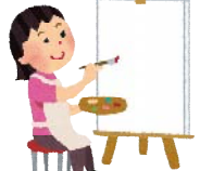
リファイン緑丘 森

得意科目は 美術 に 体育 と思っていま したがどうやら好き だっただけの様 でした(´_`)