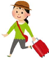
リファイン岡崎北 駒井