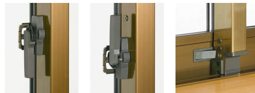
補助ロック付クレセント サブロック

障子が確実に閉まっていない場合、クレセントが最後まで回らない仕組みになっており、空かけ状態に気づくことができます。さらに、補助ロック・サブロックが標準仕様となっていますので、外部からの侵入にも安心できます。