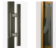
大型把手 アシスト把手