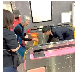
唯一のトラブル？！ 「切符が出てこない！」 by 西村さん