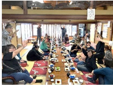
お昼は『國之家さん』 美味しかったです♪