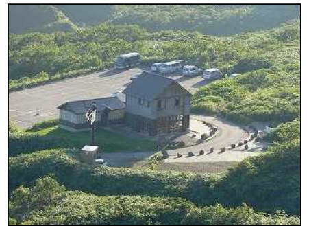
八合目避難小屋と駐車場を眼下に

・誰もいない静かな池のすばらしい眺め。岩手山が美しく望まれる。しばらくして4~5人が登ってきた。この場所を彼らに譲り、私は男女岳へと登る。