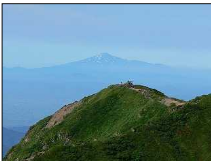
男女岳から鳥海山を望む