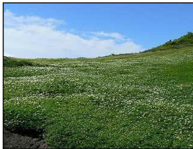
チングルマの白い絨毯