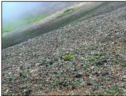
見事！一面コマクサの群落