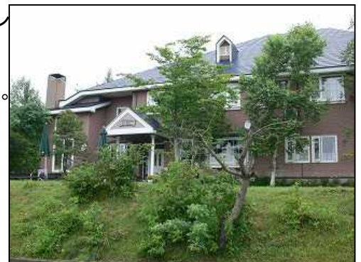
ペンション「だもん」

今日は非常にいい一日だった。 明日からこの旅の後半が始まる。 これからは のんびり山旅、観光という予定 そろそろ天気も不安定になるだろう まあ 気ままに行こう