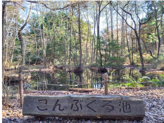
こんぶくろ池自然公園・東京ドーム4個分の広さ TX (つくばエクスプレス) 柏の葉キャンパス駅近く