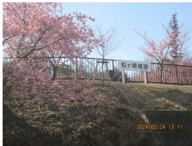
北柏・松ヶ崎城跡公園 河津桜が満開 千代田線北柏駅から徒歩15分