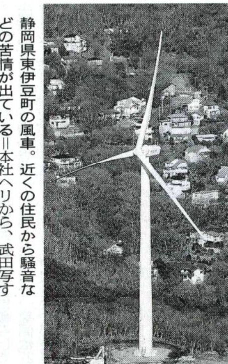
静岡県東伊豆町の風車。近くの住民から騒音などの苦情が出ている。